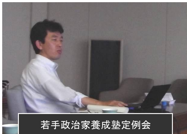
若手政治家養成塾定例会 障害者福祉のあるべき姿について