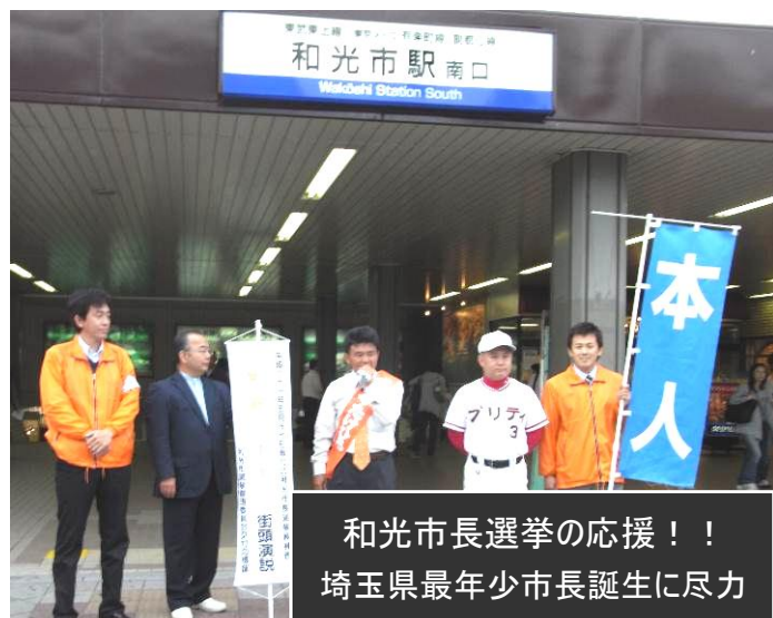
和光市長選挙の応援！！ 埼玉県最年少市長誕生に尽力