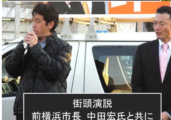
街頭演説 前横浜市長 中田宏氏と共に