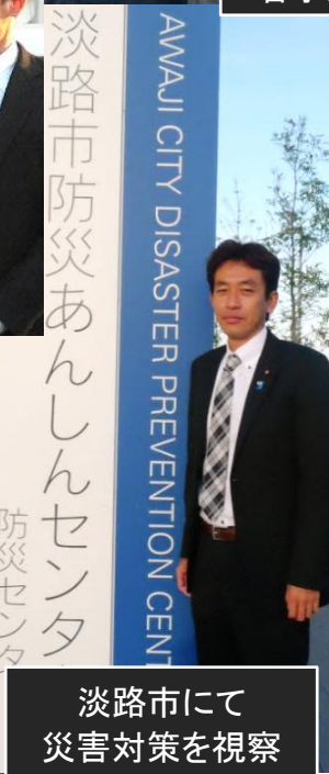
淡路市にて 災害対策を視察