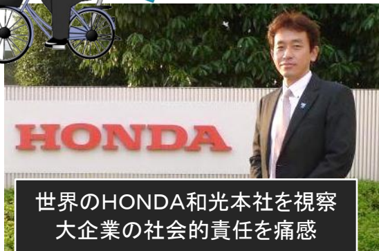
世界のHONDA和光本社を視察 大企業の社会的責任を痛感