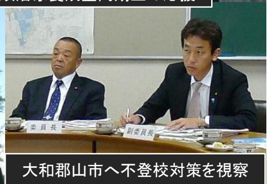
大和郡山市へ不登校対策を視察