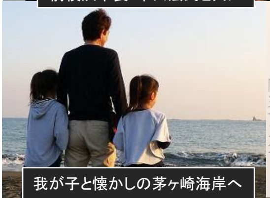
我が子と懐かしの茅ヶ崎海岸へ