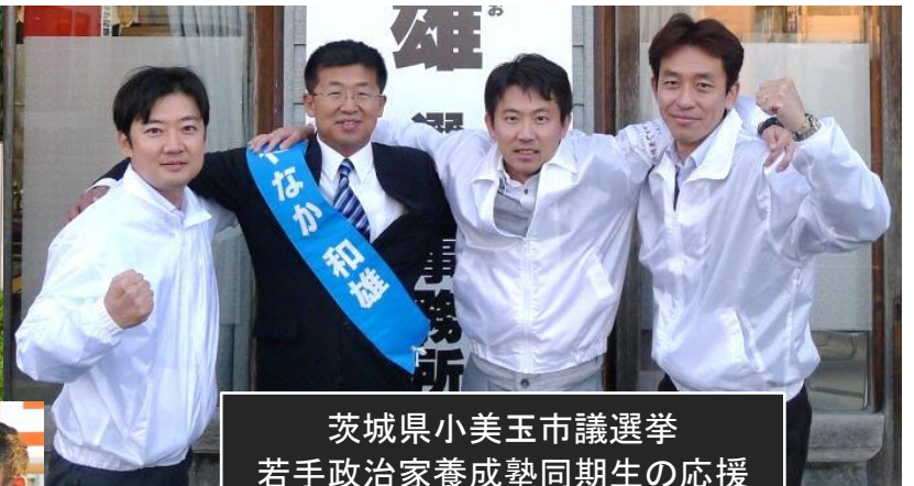
茨城県小美玉市議選挙 若手政治家養成塾同期生の応援