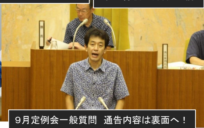
9月定例会一般質問 通告内容は裏面へ！