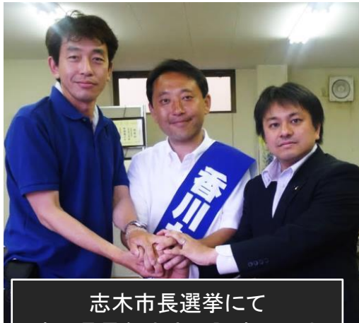
志木市長選挙にて 埼玉県最年少市長誕生に尽力