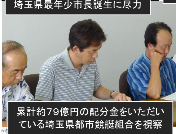
累計約79億円の配分金をいただ いている埼玉県都市競艇組合を視察