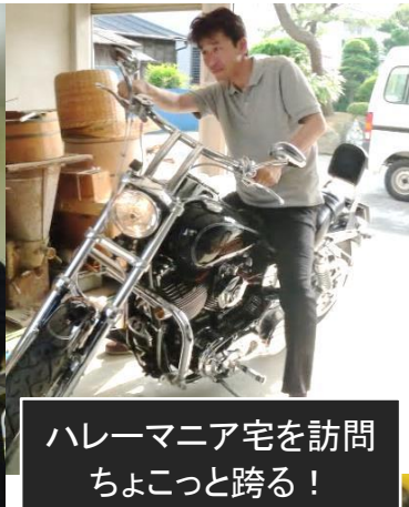
ハレーマニア宅を訪問 ちょこっと跨る！