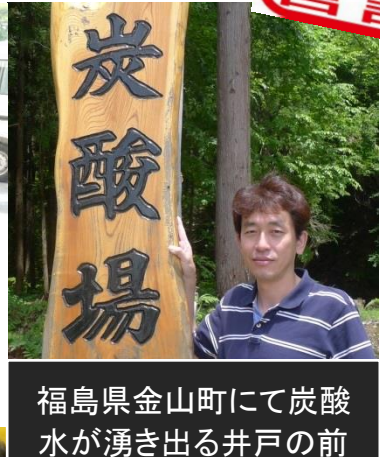
福島県金山町にて炭酸 水が湧き出る井戸の前