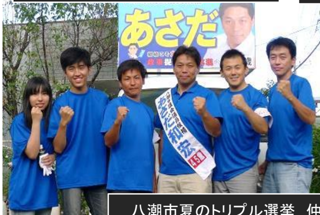
八潮市夏のトリプル選挙 仲間の県議補選、市議選を応援