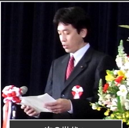
次の世代へ 小学校卒業式での祝辞