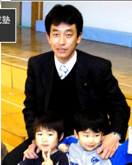
掛川市の幼保園を視察 現地の子ども達と