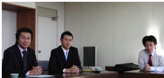
羽生市役所にて若手議員との議案勉強会 特に騎西の中山議員とは積極的な 情報交換を行っています！