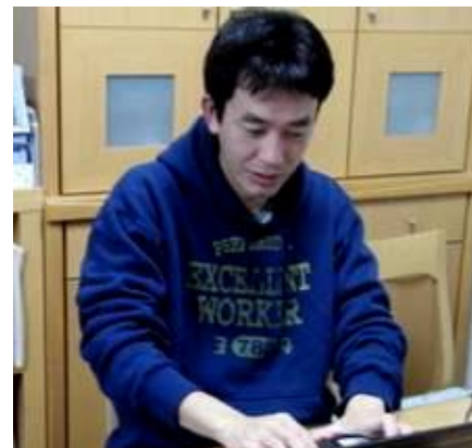
情報公開の責任 自宅にてブログの更新