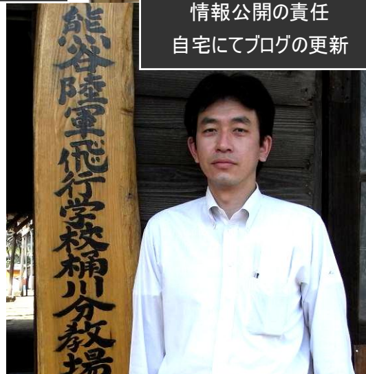
熊谷陸軍飛行学校桶川分教場にて 国を想う……。