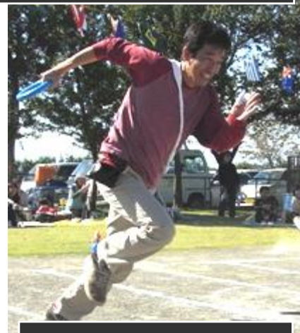
保育所の運動会にて 運動不足を痛感・・・。