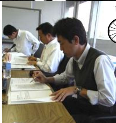
若手政治家養成塾定例会 東松山市民病院の現状について