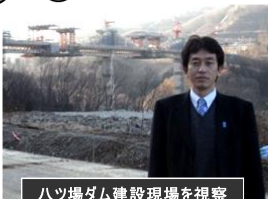
ハツ場ダム建設現場を視察 スケールの大きさに驚きました