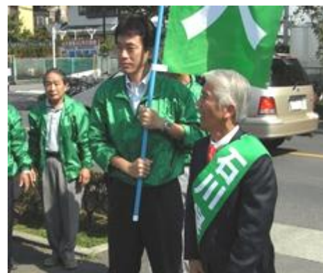
春日部市長選挙にて 石川市長 2 期目の挑戦に尽力