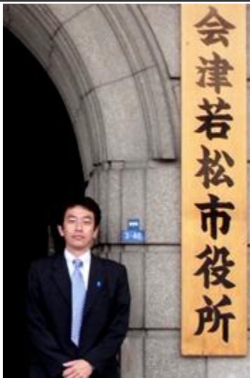
青年地方議員の会視察 議会基本条例について