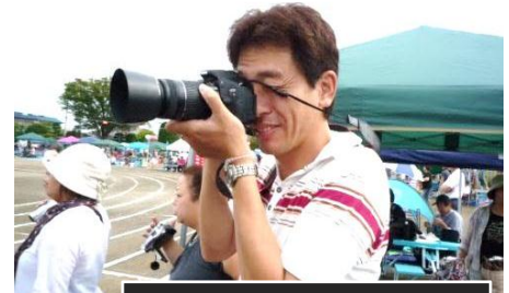
小学校運動会にて 親ばかぶり炸裂(笑)