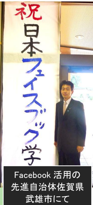
Facebook 活用の 先進自治体佐賀県 武雄市にて