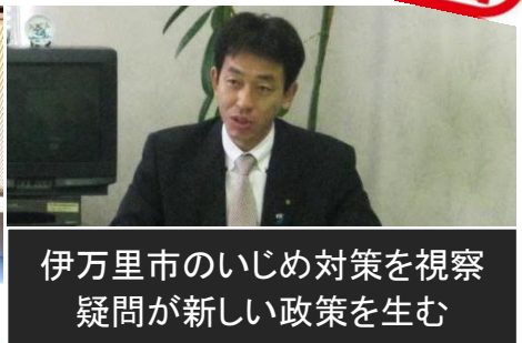
伊万里市のいじめ対策を視察 疑問が新しい政策を生む