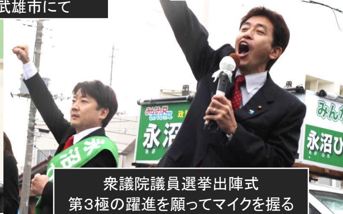
衆議院議員選挙出陣式 第3極の躍進を願ってマイクを握る