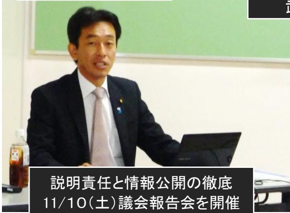
説明責任と情報公開の徹底 11/10(土)議会報告会を開催