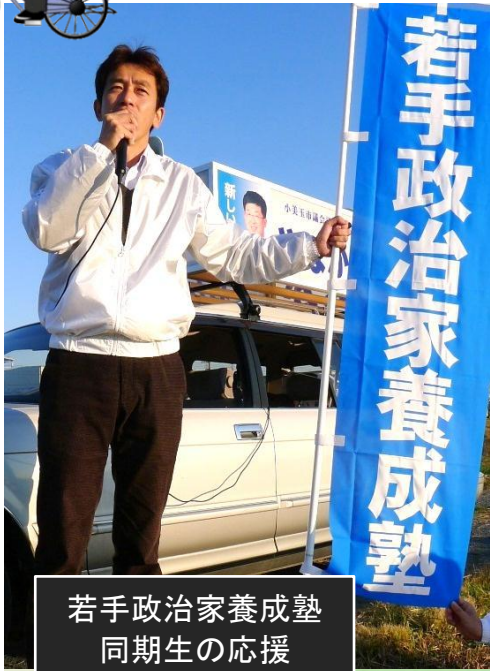
若手政治家養成塾 同期生の応援