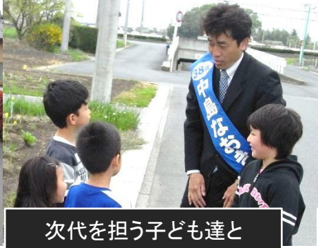
次代を担う子ども達と