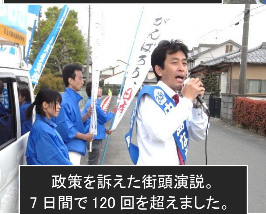
政策を訴えた街頭演説。 7日間で120回を超えました。