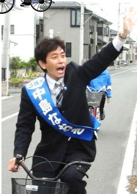
元祖・自転車選挙！1週間の 走行距離はなんと450キロ超