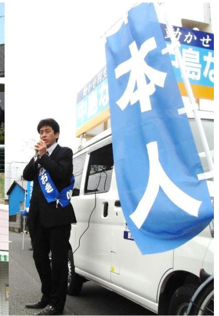
毎度おなじみの 青い「本人」のぼりとともに