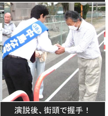
演説後、街頭で握手！