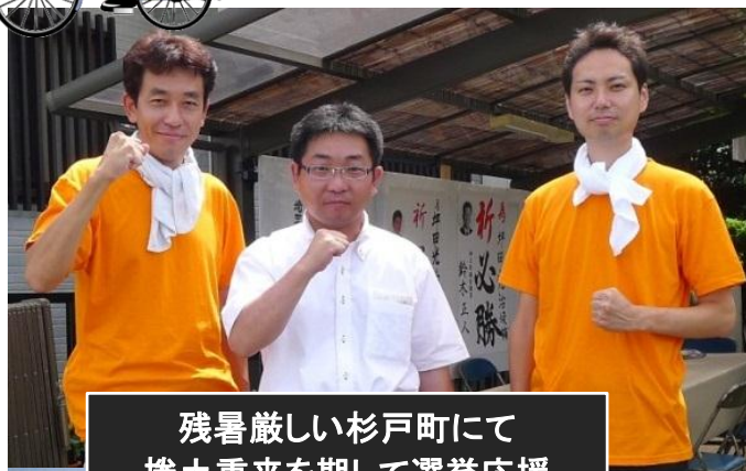
残暑厳しい杉戸町にて 捲土重来を期して選挙応援