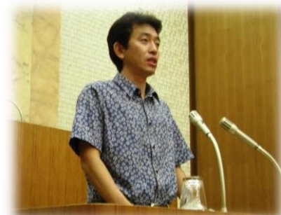
中島なおき 発言録

迫りくる地方分権時代、地域間競争に勝ち抜き、我々は歴史ある羽生市を後世に引き継いでいかなければなりません。そのためには、守るべきものはしっかりと守る。そして見直すべきものはしっかりと見直していく。そういった改革の強い意思と姿勢を積極的に全国に発信していくことは、今後ますます重要になってくるものと私は確信しております。そんな思いから 2 項目 8 点について質問、提案をしました。