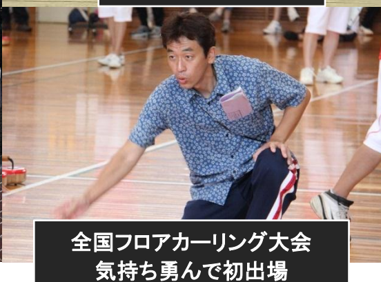
全国フロアカーリング大会 気持ち勇んで初出場