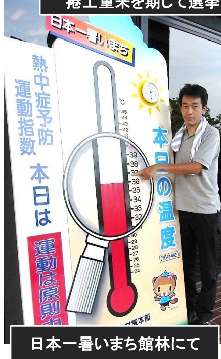
日本一暑いまち館林にて