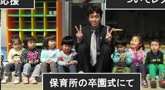
保育所の卒園式にて