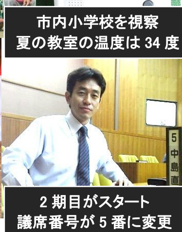
2期目がスタート 議席番号が 5 番に変更