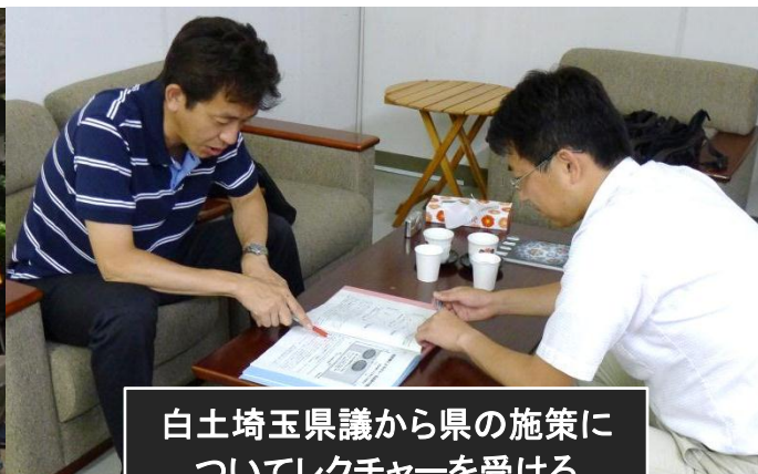
白土埼玉県議から県の施策に ついてレクチャーを受ける