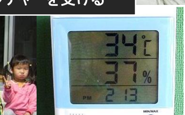
市内小学校を視察 夏の教室の温度は 34 度