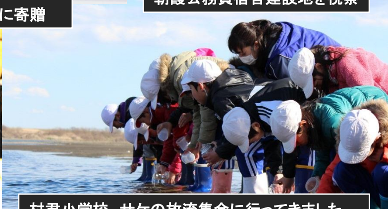
村君小学校 サケの放流集会に行ってきました。