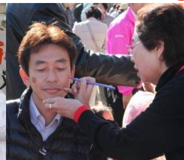
ゆるキャラ®さみっとフェイスペイントに挑戦！