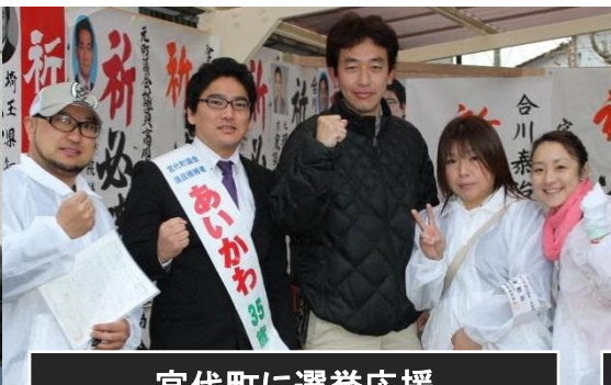
宮代町に選挙応援候補者よりも目立ってます。(笑)