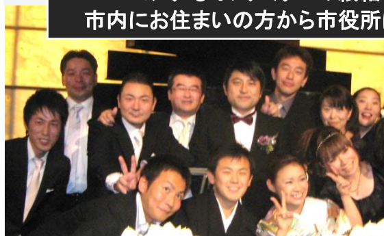
仲間の結婚式に出席 県内外の若手地方議員が大集合