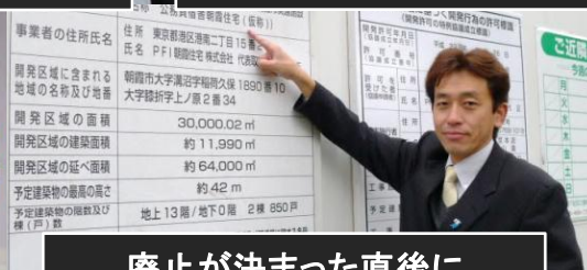
廃止が決まった直後に 朝霞公務員宿舎建設地を視察