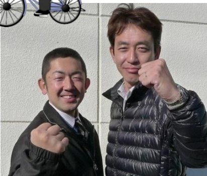
行田市議柿沼氏と意見交換