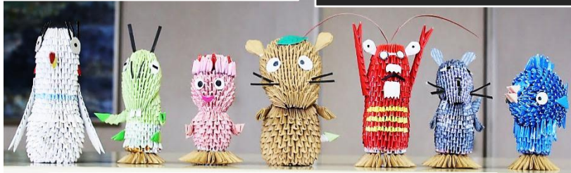
ムジナもんファミリーの紙細工 市内にお住まいの方から市役所に寄贈